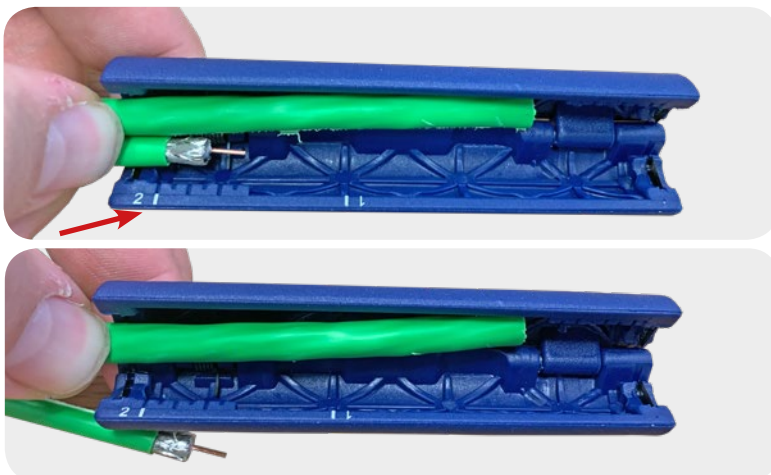
Abb.: Koaxialkabel in Abisolierwerkzeug einlegen, Schritt 3

1.3 Legen Sie nun das Datenkabel und das Koaxkabel gemeinsam von links in das Abisolierwerkzeug ein, die weiße „2“ muss richtig herum zu lesen sein. Das Koaxkabel muss, zur Orientierung, mit der Mantelkante wieder bündig zum Markierungsstrich der „2“ liegen.