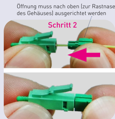
Abb.: Verriegelung anbringen