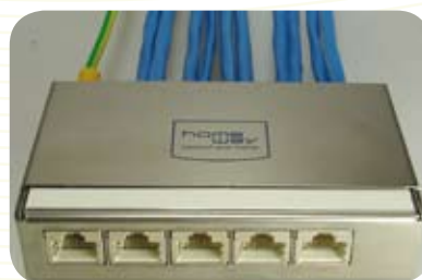
Bestellnr.: HAXHSV-E0500-C002 Bezeichnung: HW-ED 5 H